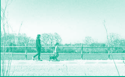
Portada: Camí de vianants entre els barris de la Campinya i Sant Isidre, pavimentat recentment.

Edita: Ajuntament de Santa Eulàlia de Ronçana Coordinació de continguts: Regidoria de Comunicació Disseny i maquetació: gloryafterpeace.es Impressió: Gràfiques Duran 3.200 exemplars