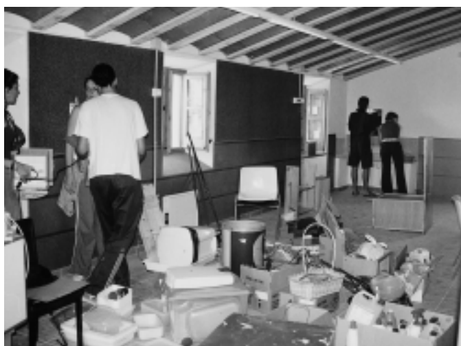
L'Esplai celebrarà el 25è aniversari a Sant Simple

armaris. L'Esplai hi celebrarà aquest any, el 25è aniversari de l'entitat. Les altres obres que han acabat són les del camí del Serrat i Salve Regina. Els treballs incloïen la pavimentació, els aparcaments de l'Escola Bressol i dues plataformes de reducció de velocitat, una davant del centre docent i una altra a la corba de Can Peles. Ara només resta plantar l'arbrat durant l'hivern, que és l'època adequada. La segona fase del camí de Salve Regina (fins el barri de la Primavera) es preveu que s'enllestirà el 2005.