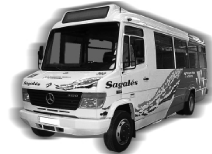
El transport municipal arribarà fins a Granollers

Cada recorregut es cobrirà en 45 minuts. El servei començarà a les 6:15 quan sortirà de Pinedes del Castellet i finalitzarà la jornada, també a Pinedes, a les 21:15, després d'haver fet el darrer