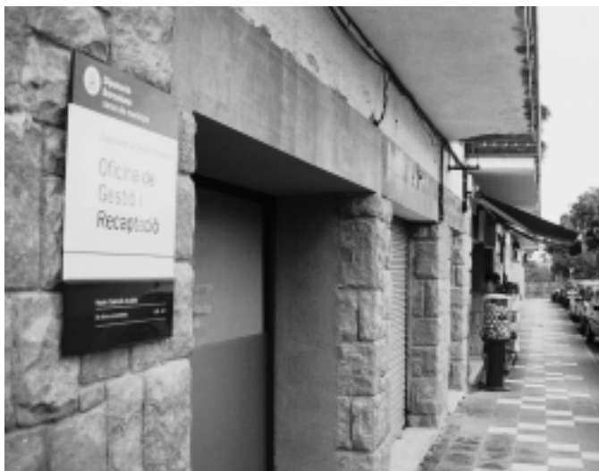
La nova oficina de recaptació es troba a la plaça de l'Ajuntament

La delegació de l'Organisme de Gestió Tributària de la Diputació a Santa Eulàlia, ha comportat un seguit de canvis en el sistema de recaptació. Un d'aquests canvis, que ha afectat els ciutadans, ha estat que la taxa d'escombraries es desglossa en dos rebuts: un per al servei de recollida domiciliària i un altre per a la selectiva i per a la deixalleria. Això ha estat així perquè és el sistema utilitzat per la Diputació a tots els municipis. El canvi ha comportat confusió entre els veïns. Cal dir que la suma dels dos imports equival al rebut de l'any passat més l'increment acordat (7,5%).