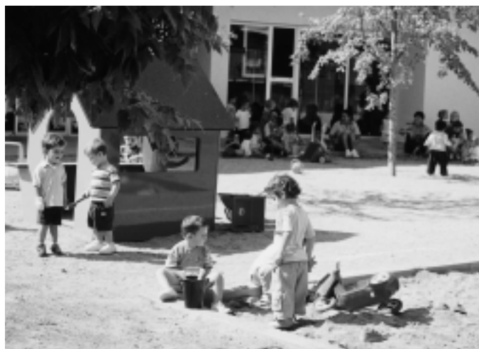
Alguns infants al pati de l'Escola Bressol l'Alzina