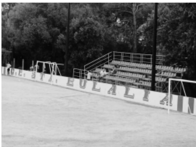
Les graderies del camp de futbol estan integrades a l'entorn

aleshores el projecte. Les graderies s'han aixecat al costat del bar del camp de