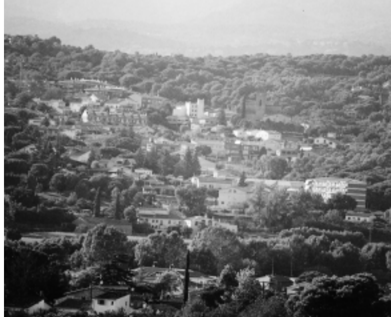
L'evolució futura de Santa Eulàlia dependrà del POUM

El POUM determinarà els usos del sòl a tot el poble