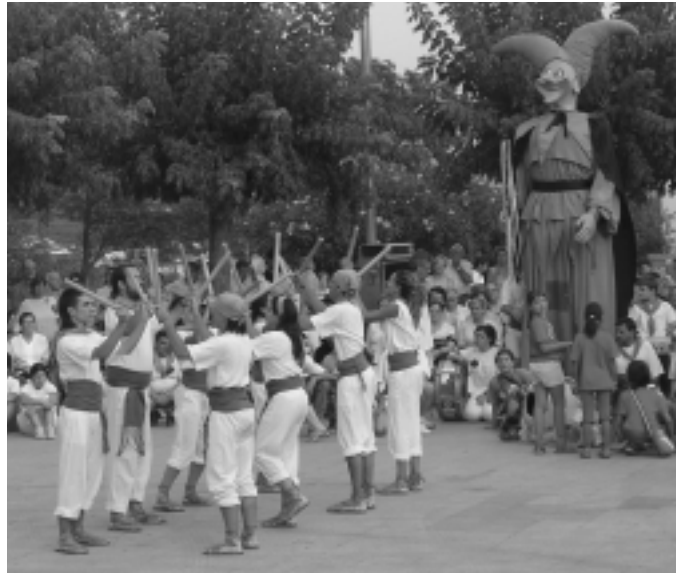
Els Bastoners de Santa Eulàlia, durant la Festa Major

Tant la Comissió de Festes com la dels Colors van fer que la darrera Festa Major fos realment participativa. Tot el que fa referència a aquests dies de festa es va vehicular a través de la Comissió de Festes. Alguns dels canvis introduïts a la del 2004 es van fer a instància d'aquest organisme, sobretot els que van introduir-se a la plaça de l'Ajuntament. L'espai es va guarnir i es va il·luminar millor; la circulació als seus voltants es va fer en un únic sentit i el festival