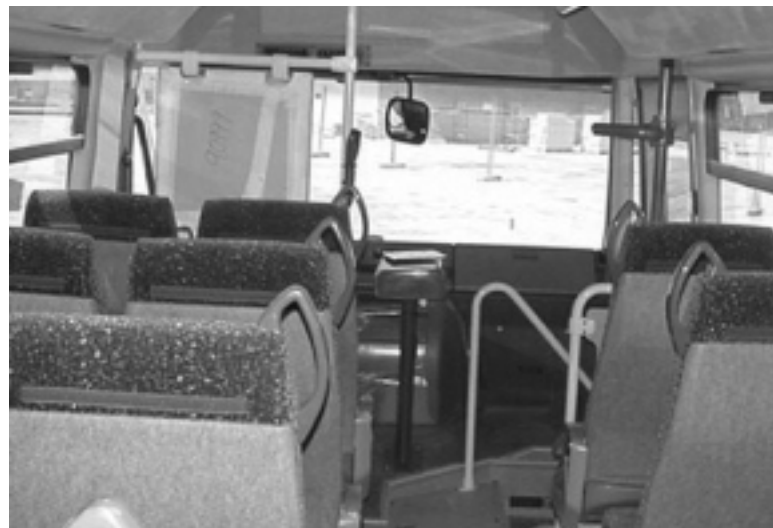
El bus urbà de Santa Eulàlia tindrà 25 places

trajecte des de Granollers. Entre les 14 h i les 15:25 hores, el bus no funcionarà. Hi haurà 8 sortides de Santa Eulàlia i 8 més de Granollers. D'aquesta manera es faran 8 itineraris diaris i circulars d'una hora i mitja.