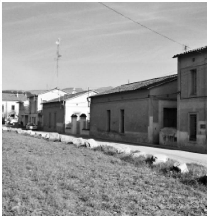
Les obres començaran a principis del 2004

El consultori provisional s'ha de substituir en els pròxims anys per un Centre d'Assistència Primària (CAP), com l'Àrea Bàsica de Salut (ABS) de la Vall del Tenes. En la sessió del 28 de novembre, es va donar a conèixer que la Generalitat ja ha acceptat oficialment la cessió de terrenys davant de Can Ferrer, al Rieral, que el consistori va fer l'estiu passat per a la construcció d'un CAP al poble..