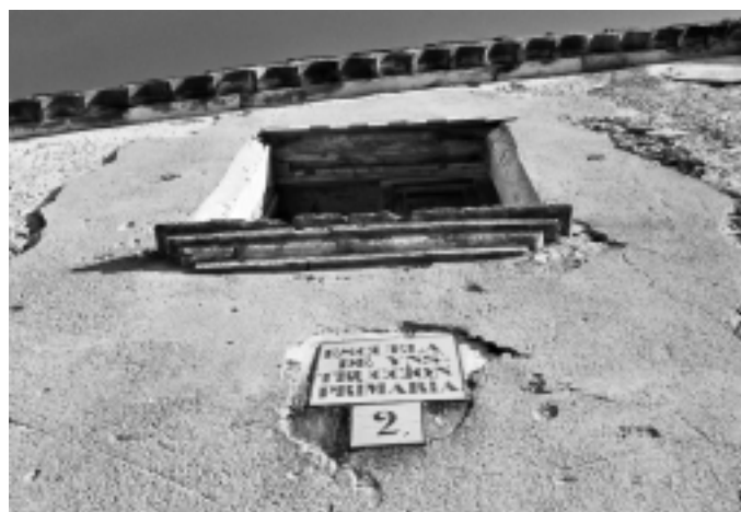
Sant Simple ha d'ocupar l'activitat de l'Esplai