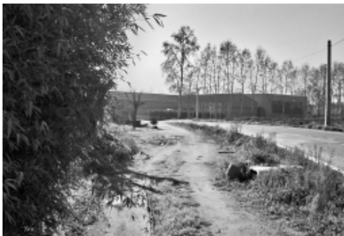
Un pas de vianants també podria arribar a la Fàbrica

L'Ajuntament considera important aquesta actuació perquè es tracta d'un vial per on circulen diàriament centenars de vehicles i que és un nexa d'unió entre la Sagrera, i barris com la Primavera, el Serrat o els Ametllers. A més, l'obertura de l'Escola Bressol Municipal farà que, a partir del setembre que ve, el trànsit sigui