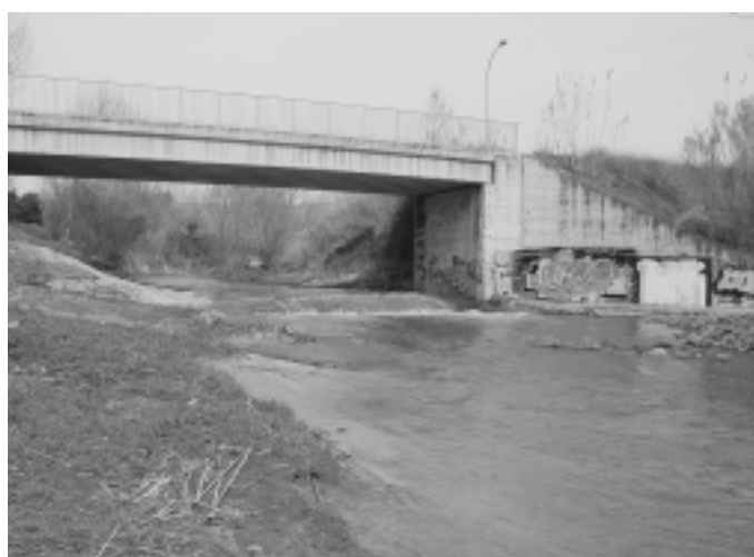
El mateix pont en l'actualitat.