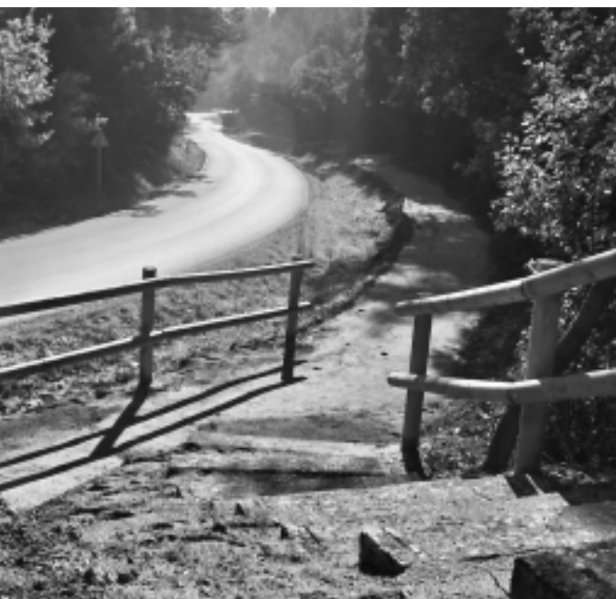
El camí de vianants per accedir a l'IES era una vella reivindicació

Una de les reivindicacions històriques de l'IES La Vall del Tenes i de l'Associació de Mares i Pares d'Alumnes (AMPA) de l'Institut era el camí per a vianants que es va habilitar, el novembre passat, al costat de la carretera de la Rovira. El vial, de terra i que disposa d'una barana, enllaça el centre docent amb les voreres del camí de la Rovira i el de la deixalleria. Es tracta d'un pas còmode per anar a peu i que està integrat a l'entorn. Alguns joves que estudien a l'IES La Vall del Tenes utilitzen el camí