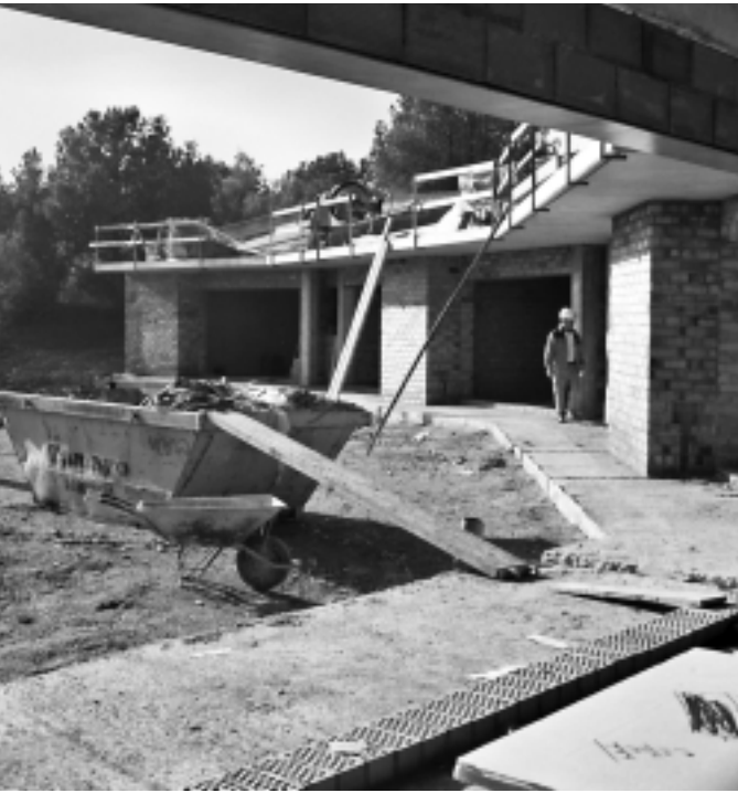
Les obres de l'Escola Bressol Municipal, aquest desembre

L'Escola Bressol Municipal començarà a funcionar a principis del setembre que ve. Precisament, l'establiment d'aquest servei es va aprovar en el ple del 27 de novembre. Ara mateix, la subcomissió d'Escola Bressol del Consell Escolar Municipal està treballant en diferents aspectes previs a l'inici de l'activitat. El calendari està gairebé definit. A finals de desembre, els pressupostos municipals 2004 ja han de preveure la dotació pressupostària per als quatre últims mesos del proper any. Després, al febrer s'hauran de publicar les bases per al