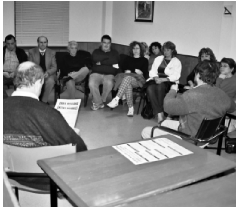
Una reunió de la Comissió de Festes, el 3 de desembre

Coordina les entitats i persones preocupades per l'acció social. Hi ha una àmplia diversitat d'àmbits d'actuació com els infants, els joves,