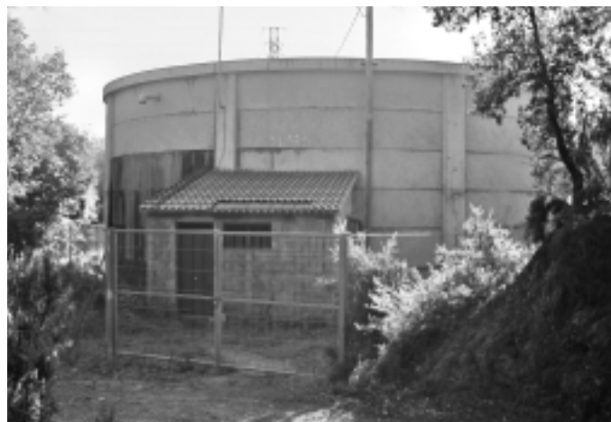
Els dipòsits, com el de Puigdomènec, han de rebre aigua d'ATLL

L'arribada d'aigua a través d'Aigües Ter-Llobregat es fa més que necessària després dels problemes dels darrers estius. El pressupost del projecte és de 834.803,36 euros (IVA inclòs). L'elevat cost del projecte, ja aprovat, ha fet que el consistori hagi demanat diners als PUOSC i al FEDER. Al primer, per a l'any 2004 i dins del programa general, es sol·liciten 375.661,51 euros. Al segon, se'n demanen 417.401,68 per a l'anualitat 2004-2005. En total, són 793.063,19 euros. Si s'aconsegueixen les dues subvencions, les arques municipals haurien de cobrir la diferència (41.740,17 euros) de l'import pressupostat al projecte.