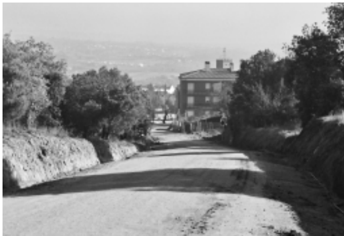
La pavimentació del camí de Salve Regina és prioritària