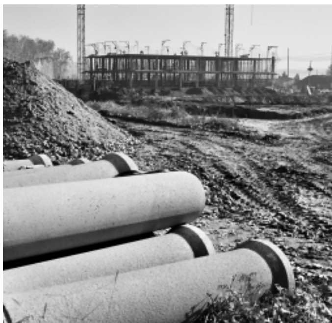
El pla director de clavegueram començarà al Rieral

tres físics i en base a les densitats d'habitatge i de pluja recollida. L'estudi sobre el clavegueram ha de concloure amb les actuacions a dur a terme en els pròxims anys i prioritàriament entre el 2004 i el 2005. Donada l'urgència al barri antic del Rieral i al Pla Parcial del Rieral, el consistori ha decidit començar el Pla director en aquest àmbit. La solució s'ha d'aplicar amb celeritat per executar les obres durant el primer semestre de 2004, pla que es va acabar de redactar a finals de novembre.