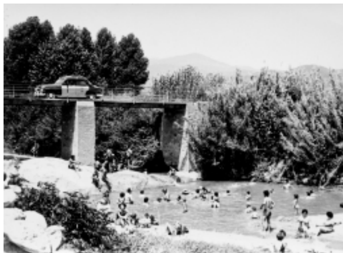
El pont de Can Donat en una foto antiga del calendari.

Tindrà lloc, com en els dos últims anys, a la La Fàbrica. Hi haurà sopar, a partir de les 21:30 h i, després, ball. Les inscripcions s'han de fer a l'Ajuntament abans del 23 de desembre. Les places són limitades.