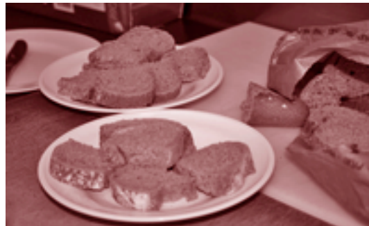
Els productes, sempre frescos, es cuinen directament a les escoles bressol

de les escoles, tant les cuineres com les educadores valoren molt positivament la recuperació dels sabors en molts dels productes, ja que tots són naturals i frescos; així com el fet de veure arribar els propis pagesos del poble amb els seus productes de temporada. L'adaptació dels nens es va fer molt ràpidament i les educadores asseguren que mengen molt bé i amb una qualitat extraordinària.