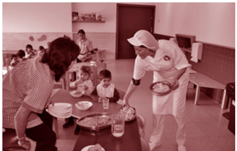
El pa està elaborat amb farina d'espelta de Gallecs