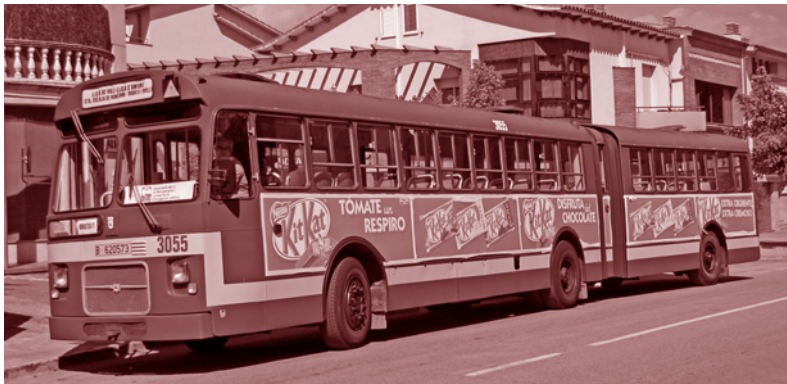
Uns dels autobusos històrics al seu pas per Santa Eulàlia de Ronçana

Durant tota la setmana es van fomentar els vehicles col·lectius i no contaminants com a alternativa real de transport respectuós amb el Medi Ambient