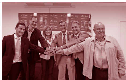
El 777 Bus Exprés continua millorant.

També s'ha refet la parada de Can Magre, col·locant-hi una marquesina i nova senyalització alhora que també s'han canviat els pals indicatius en altres parades de la carretera de Barcelona per millorar-ne la visibilitat.