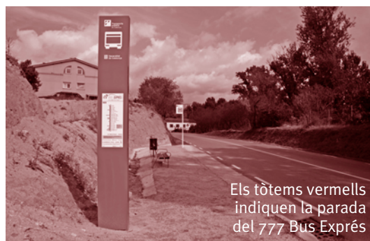
Els tòtems vermells indiquen la parada del 777 Bus Exprés

El passat 23 de setembre tots els ajuntaments de la Vall del Tenes, entre els quals el de Santa Eulàlia de Ronçana, a més del de Parets i la Diputació de Barcelona van signar un conveni de col·laboració per millorar l'estat de tres carreteres locals per les que circula el transport públic de la Vall del Tenes. Concretament, la Diputació de Barcelona serà l'encarregada d'executar les obres de senyalització vertical i horitzontal, consistents en el repintat de les marques vials i la substitució dels senyals verticals de les carreteres BV-1435, BV-1602 i BV-1604, per les quals circula la línia de servei de transport públic regular 777 Bus Exprés que connecta Barcelona amb la Vall del Tenes, passant per Parets. Una altra de les actuacions que preveu executar aquest conveni és l'adaptació semafòrica de tot el recorregut, donant prioritat al pas dels autobusos que fan el servei de transport públic regulars de viatgers a les tres carreteres. La intenció és agilitzar el recorregut del transport públic fent-lo més competitiu respecte el transport privat i convertint-lo en una alternativa sostenible i respectuosa amb el medi ambient.