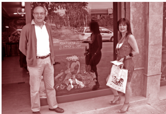
L'entrega del premi davant l'aparador premiat

El dia 22 de setembre va començar la setmana de la Mobilitat Sostenible i Segura, que es va allargar fins el 29 del mateix mes. Aquesta setmana es caracteritza perquè el servei d'autobús urbà és gratuït per a tothom, d'aquesta manera se'n fomenta l'ús i s'introdueixen noves formes de mobilitat a la rutina dels veïns de Santa Eulàlia.