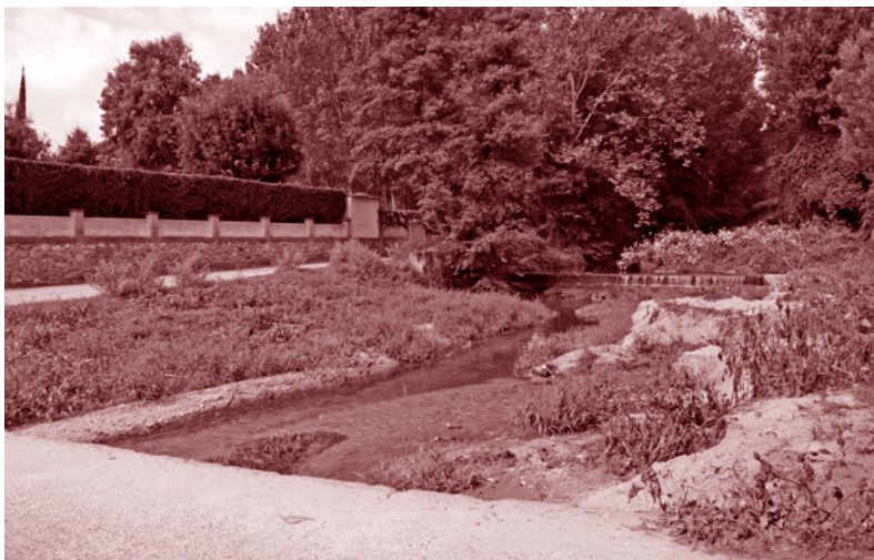
El riu tenes al seu pas pel Gual de Sant Isidre

El cost estimat de totes les actuacions és de 8 milions d'euros. El conveni estableix que l'ACA es farà càrrec de la majoria (el 100% de la bassa de laminació i el 75% del pla de millora de l'espai fluvial). La resta estarà finançada amb la subvenció aconseguida del fons europeu FEDER (1.083.621€), amb una subvenció del Consorci per a la Defensa de la Conca del riu Besòs i una aportació petita de l'ajuntament.