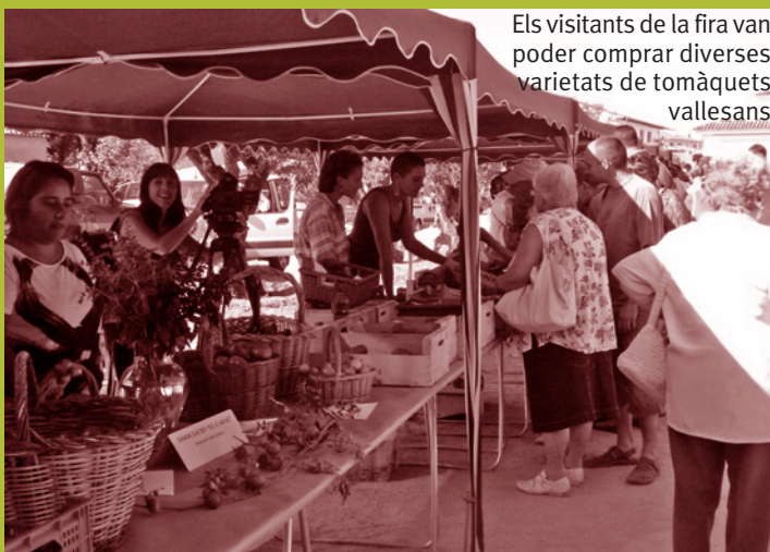
Els visitants de la fira van poder comprar diverses varietats de tomàquets vallesans

Aquesta és una iniciativa que s'ha organitzat conjuntament des de l'ajuntament de Santa Eulàlia de Ronçana, el Consell Comarcal del Vallès Oriental i el cuiner vallesà Pep Salsetes, i que s'emmarca en un projecte europeu per a la promoció del desenvolupament local sostenible anomenat Rururbal. Els organitzadors destaquen el caràcter didàctic de la trobada i la gran acollida que ha tingut entre el públic, que s'ha mostrat molt interessat per conèixer aquests productes de proximitat.