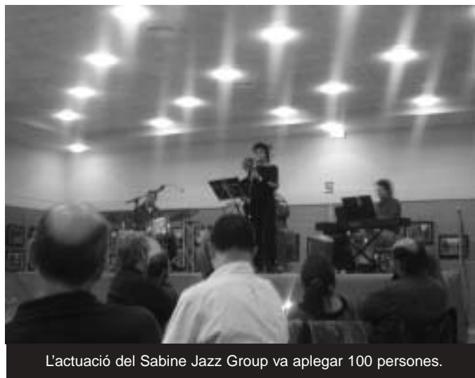
L'actuació del Sabine Jazz Group va aplegar 100 persones.

Durant el pont de la Puríssima, entre el 4 i el 12 de desembre, també es van poder visitar dues exposicions. La que es va fer al pavelló poliesportiu, titulada Jocs del Món , era interactiva i permetia als visitans jugar