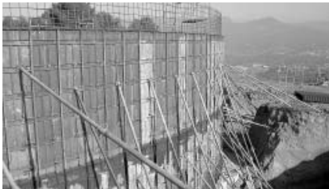
El dipòsit que es construeix a Rosàs, amb capacitat per 5.000 m 3 .

La portada d'aigua d'Aigües Ter-Llobregat (ATLL) hauria d'estar acabada abans de l'estiu. Aquesta és la previsió amb què treballa la direcció d'obra i dels ajuntaments de Santa Eulàlia, Bigues i Riells, Sentmenat i Caldes de Montbui, pobles que s'han de beneficiar de l'abastament. Els treballs es van iniciar al setembre a Caldes i han continuat simultàniament a altres zones, com és el cas de Santa Eulàlia. Des de principis de novembre s'està construint, a la zona més alta del municipi, a Ro-