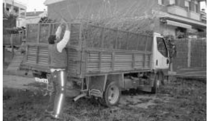
L'equip de Manteniment s'ha reforçat fins l'abril.

A diferència del 2003, la Generalitat ha cobert totes les places que l'Ajuntament va sol·licitar i s'han concedit els Plans per 6 mesos i no pels 3 que, per qüestions burocràtiques, es van concedir l'any passat. A més hi ha la novetat que el govern català es fa càrrec del 100% del sou d'aquests treballadors. L'any passat, el consistori va haver de fer front a la meitat dels diners. Els Plans d'Ocupació continuen amb el que ha estat una pràctica