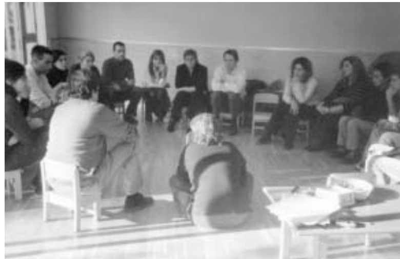
L'Escola de Pares és una iniciativa de l'Escola Bressol l'Alzina.

Els temes de les conferències són els mateixos que una setmana abans s'han tractat a l'Escola Ronçana, on es fan xerrades per a pares i mares amb canalla de