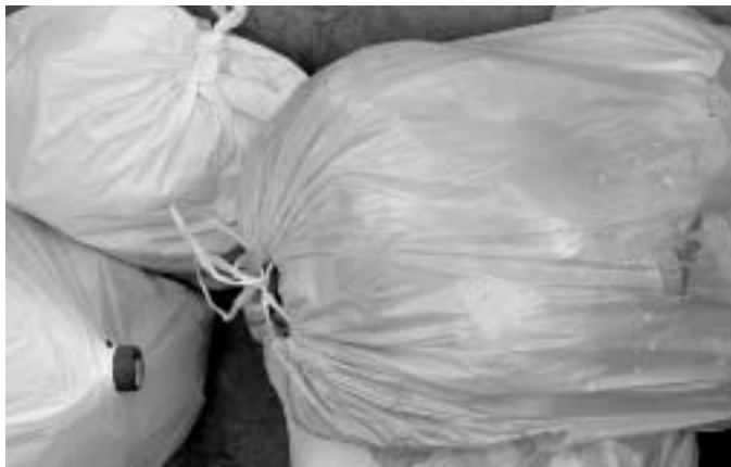
La matèria orgànica representa un 40% de la bossa d'escombraries.

La gestió de les deixalles al municipi és una prioritat. Per això, en els pròxims mesos Santa Eulàlia afegirà la recollida orgànica a la llista de selecció d'escombraries que ja es fa amb el paper, el vidre i els envasos. L'estudi sobre residus municipals que s'ha fet en els darrers mesos mostra com es generen cada cop més deixalles i com n'és d'insostenible la situació actual. És per això que en el transcurs del primer semestre del 2005, l'Ajuntament endegarà un nou sistema de gestió. Un dels principals objectius és passar de l'actual