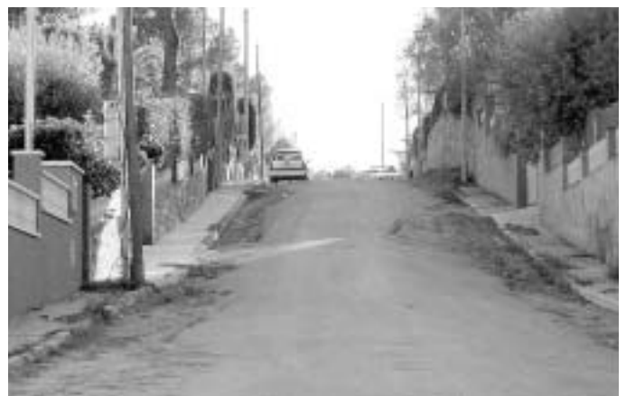
Les obres d'urbanització són prioritàries a força zones.

Després d'alguns anys de paralisi, fa uns mesos, que els projectes de Can Feu i Torre del Gos estan definitivament