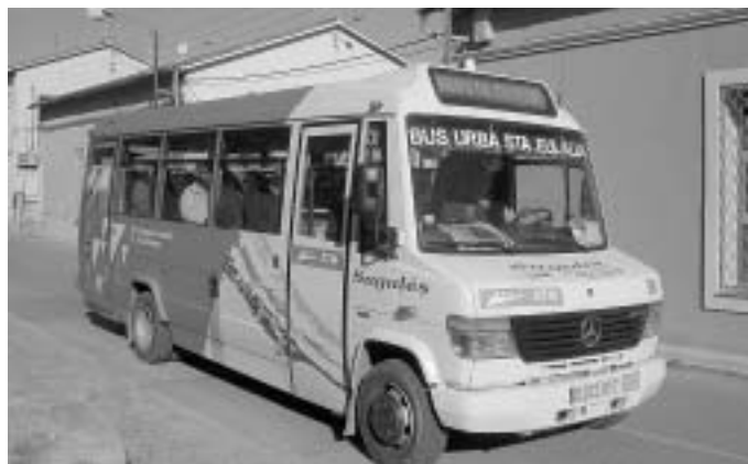
El bus municipal, a La Sagrera.

Pel que fa als horaris, el bus ha modificat els dos primers trajectes matinals que surten de Santa Eulàlia en direcció a Granollers. Els recorreguts que començaven a les 6:15 i a les 7:10 de les Pinedes de Castellet surten, des del 8 de novembre, 10 mi-