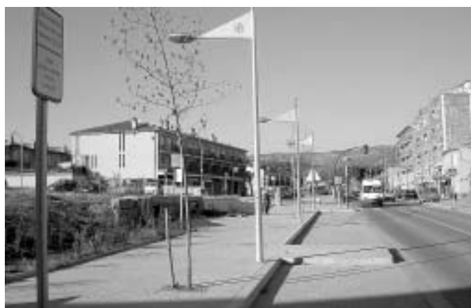
La multa per no respectar la limitació serà de 30 euros.

L'aparcament màxim en les zones blaves, que són gratuïtes, és de 90 minuts entre les 8 del matí i les 2 de la tarda, i entre les 4 de la tarda i les 8 del vespre. La multa per incomplir aquests horaris és de 30 euros. Inicialment cada conductor haurà de deixar un paper a l'interior del