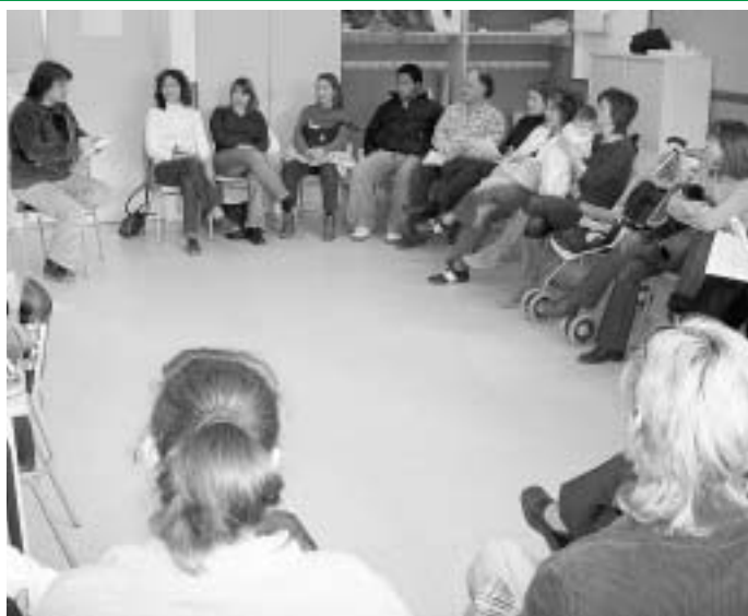
La xerrada del 15 de desembre a l'Escola Ronçana.

La tercera iniciativa que completa el projecte global del centre docent s'anomena l'Espai de Joc. S'iniciarà el curs que ve, al setembre. Es tracta d'un lloc de trobada i relació dirigit a totes les famílies de Santa Eulàlia amb nens i nenes d'entre 1 i 3 anys. En aquest espai els pares i mares conviuran, es relacionaran i jugaran amb els seus infants en un entorn segur i acollidor, ple de joguines i materials didàctics. Aquesta iniciativa també servirà per contrastar informacions, expressar desitjos i opinions relacionades amb l'educació dels fills. Les mestres de l'Escola Bressol –i en ocasions altres professionals com pediatres, psicòlegs o pedagogs– duran a terme les jornades. Així, pares i mares prendran consciència de les extraordinàries capacitats que tenen els infants i de la importància d'aquests primers anys de vida. Els res-