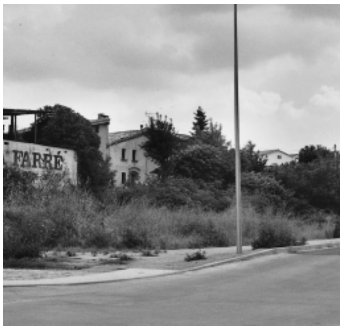
La primera promoció d'habitatges socials es farà a Can Font

pals i l'Institut d'Habitatge de la Diputació de Barcelona que, conjuntament, promouen la construcció dels habitatges. Ara, els pròxims passos són la licitació del projecte i l'adjudicació de les obres. El projecte preveu la construcció de 14 habitatges en dos terrenys prop de la zona de Can Font, entre els barris de Sant Isidre, Can Juli i Sant Cristòfol, al costat del camí antic de Granollers. Es faran dos tipus de construcció: sis cases d'una sola planta i vuit de planta baixa i pis.