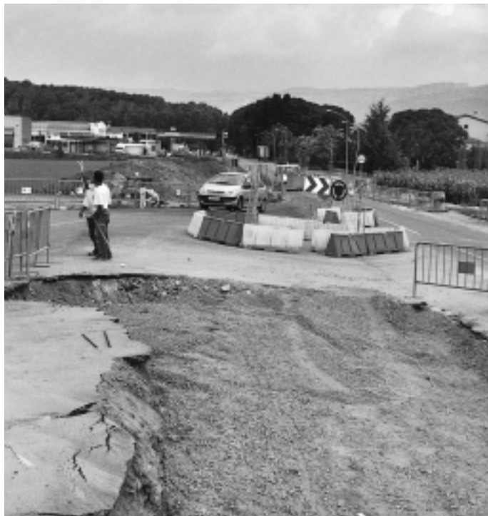
La rotonda provisional es substituirà per una de definitiva

de penalització. Tot i això, ara mateix, els treballs marxen segons el calendari previst. El consistori també estudia el possible sobrecost de les obres i qui se n'haurà de fer càrrec. Durant els mesos de juliol i agost s'han acabat pràcticament les obres realitzades davant de l'edifici Catalunya. Ara s'ultima l'adequació del marge que hi ha a sota del carrer Verge de la Salut i s'ha reiniciat la construcció de la rotonda. A l'octubre i al novembre es finalitzarà la vorera de Can Ferrer, s'asfaltarà la carretera i el carril bici.