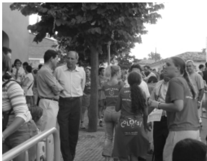
Tant els actes de la Festa Major (a dalt), com el Joc dels Colors han estat participatius (a baix)

El proper 14 d'octubre, a dos quarts de 10 del vespre, les dues comissions i els responsables municipals es tornaran a reunir per començar a definir el calendari de festes de la temporada 2003-2004 i per perfilar la Festa Major de l'any que ve.