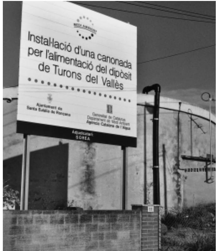
Actualment arriba aigua d'ATLL a través del dipòsit de Turons del Vallès

El cost de les obres de la connexió a ATLL és de 7 milions d'euros, gairebé 1.165 milions de pessetes. L'Agència Catalana de l'Aigua i Aigües Ter-Llobregat es faran càrrec de 4 milions d'euros i la resta (3 milions) es repartirà entre els quatre pobles que s'han de beneficiar de la connexió. Santa Eulàlia haurà de fer front a 760.000 euros, més de 126 milions de les antigues pessetes. Els Ajuntaments demanen insistentment l'inici de les obres que, en el cas de Santa Eulàlia i Bigues i Riells preveuen compartir un dipòsit per a 5.000 litres d'aigua, que es construirà al Turó de Rosàs. A més de resoldre problemes de manca d'aigua, la connexió a la xarxa Ter-Llobregat hauria de millorar la capacitat dels pous municipals.