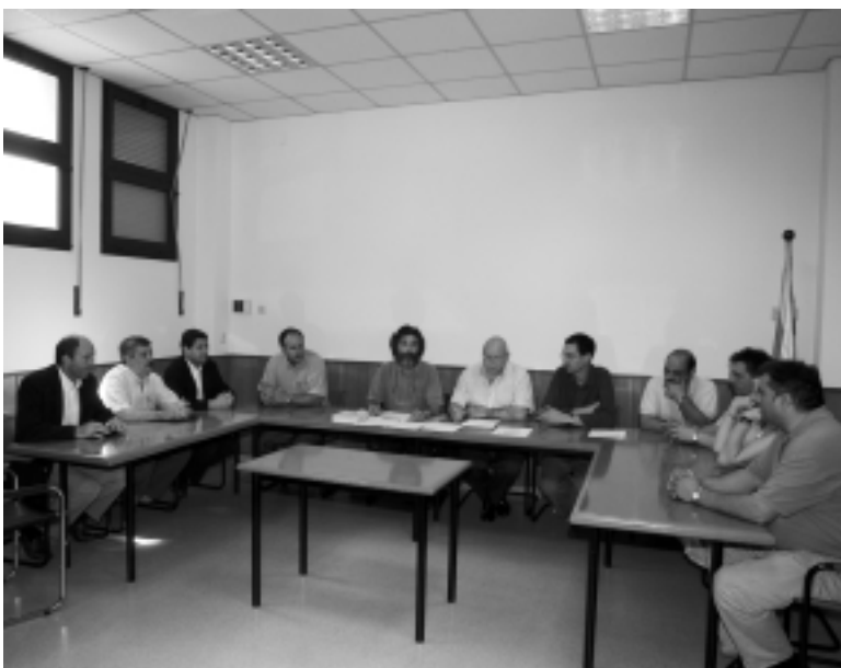
El Ple d'investidura, el 14 de juny, minuts abans de la votació