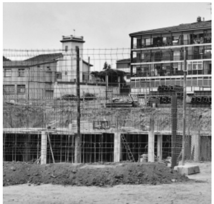
Les obres al Pla Parcial del Rieral, amb l'edifici de la Sala al fons

rebufen en els lavabos de les cases. El pla director, a més del barri antic del Rieral i dels gairebé 140 habitatges del Pla Parcial, ha de tenir en compte les aigües que van a parar a la zona i que provenen del Bosc del Forn, de la Serra i de Can Torras. El Pla haurà de definir i resoldre aquestes problemàtiques. Les actuacions hauran de ser ràpides, sobretot, per evitar més molèsties als veïns i perquè els promotors del Pla Parcial tenen previst lliurar les claus de les primeres vivendes durant l'estiu del 2004.