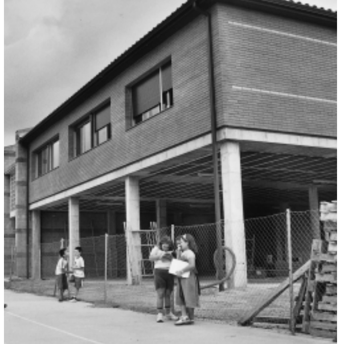
L'ampliació ofereix un nou aspecte de l'Escola Ronçana

dos serveis. Mentrestant, la planta baixa de l'ampliació quedarà com a pati cobert, a l'espera de tancar la darrera fase del nou pavelló d'aules que, de moment, ha costat més de 330.000 euros dels quals se n'ha de fer càrrec el departament d'Ensenyament de la Generalitat. Aquest setembre, una representació del consistori també s'ha reunit amb la delegada Territorial d'Ensenyament per fer-li arribar els problemes que, entre d'altres, inclouen la mala climatització que pateixen les aules: calor a l'estiu i fred a l'hivern.