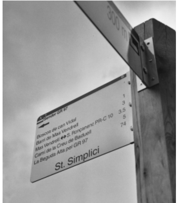
La senyalització vertical del sender PR-C10, a prop de Sant Simple

plafons indicatius a davant de l'Ajuntament i al costat del pont de l'Areny. El camí de vianants, des de la carretera i fins a Can Sabater travessa el recorregut de nord a sud. El GR-97, que ve de Caldes i va cap a Llerona, el divideix en paral·lel d'oest a est. Per això, el sender queda dividit en quatre grans sectors que, a més de la senyalització vertical, disposa de marques grogues i blanques que l'entitat excursionista Santa Eulàlia Camina va pintar. El traçat es pot fer a peu, a bicicleta o bé a cavall. La Diputació editarà tríptics explicatius amb tot l'itinerari en els pròxims mesos.