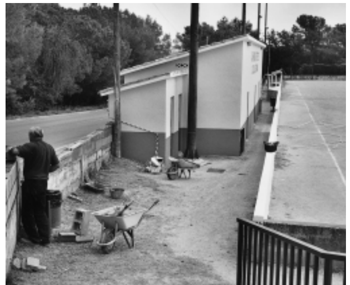
La brigada municipal ha dut a terme les obres al camp de futbol

D'altra banda, el pavelló poliesportiu ha estat de reformes durant la primera quinzena de setembre. S'ha rehabilitat la coberta de l'equipament que havia provocat problemes de goteres durant l'any passat. La reparació, que ha durat 15 dies, ha costat 38.396 euros.