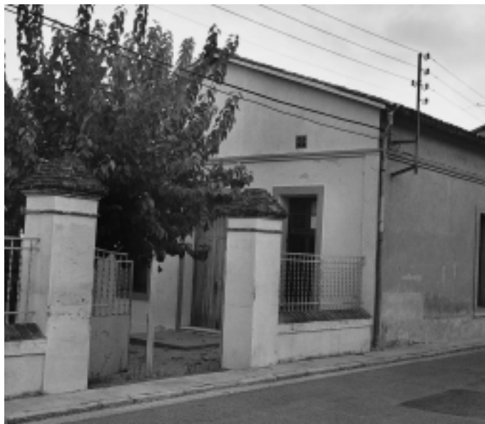
El consultori mèdic s'ubicarà provisionalment al Cau de l'Esplai (a dalt). Mentrestant Sant Simple espera monitors i nens (a baix)

La necessitat d'habilitar un consultori mèdic, al local que des de fa més de 15 anys ocupa l'Esplai, fa que sigui necessari buscar un emplaçament definitiu per a nens i monitors. Serà a l'espai de Sant Simple