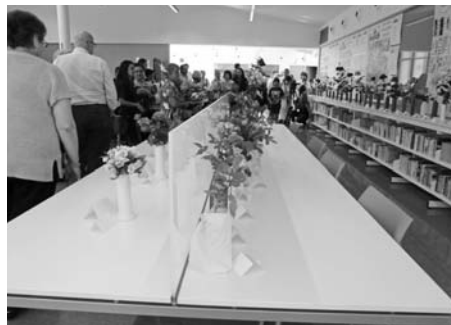
El concurs de roses.

En l'actual Societat de la Informació la biblioteca és el principal centre públic de proximitat que permet l'accés a la informació. Cal per tant conèixer i adquirir habilitats amb les noves tecnologies de la comunicació. Alguns ho veuen com una nova alfabetització que permetrà accedir-hi i esdevenir també productors d'informació i opinió.