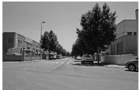
El polígon de Can Magre.

Atès que cal un replantejament de la gestió del servei de clavegueram, ja que la situació econòmica municipal s'ha vist millorada, essencialment pel que fa al sistema de pagament a proveïdors, com a conseqüència del Reial Decret 4/2012 i que aquest canvi fa necessari una reformulació del sistema de gestió del servei, així com del seu finançament. S'acorda revocar l'acord adoptat en el Ple de data 29 de desembre de 2011, de delegació de la gestió del servei públic del clavegueram municipal al Consorci per a la Defensa de la Conca del riu Besòs.