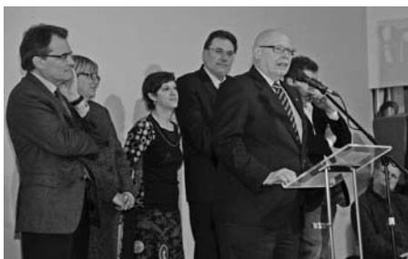
El President de la Generalitat i l'Alcalde de Santa Eulàlia en un moment de la inauguració del nou centre d'APINDEP.