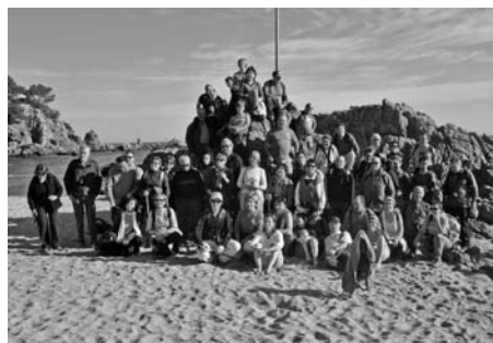
Un moment que no falta a cap sortida és la foto de família del grup. En aquesta ocasió arran de mar, pel gener, quan vam fer un tram del Camí de Ronda.

Som una entitat oberta a acollir tot aquell que el segon diumenge de cada mes estigui disposat a compartir una estona regida per aquest calendari, aquest horari i el tarannà a sobre explicitat. Així doncs ja esteu tots convidats a gaudir de les nostres passejades.