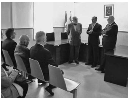
Els parlaments a la Sala de Vistes del Jutjat de Pau el dia de la inauguració.

- El mini mixt del Club Escola de Bàsquet Ronçana mantenia intactes les possibilitats de guanyar la lliga. El conjunt verd apallissava a domicili el Balenyà i afrontava un partit decisiu amb el Sant Gervasi.