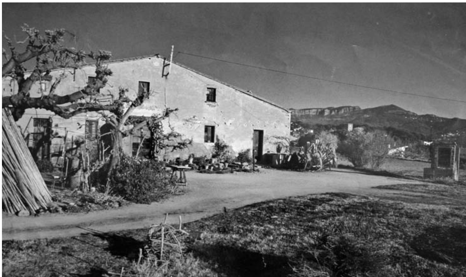
La casa de Mallorca amb els cingles al fons.