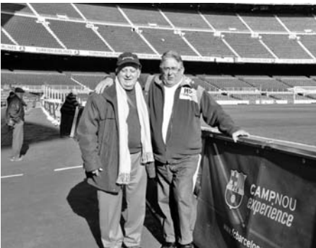
A l'estadi del FC Barcelona.

Al febrer vam anar a visitar Santa Eugènia de Berga, on destaca la seva església parroquial, un dels millors exemplars de l'art romànic a la comarca d'Osona i com a tal fou