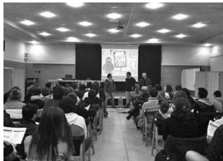
L'acte de tria dels projectes presentats als pressupostos participatius d'enguany.

Les activitats que s'han realitzat són: El 3er torneig de futbol de Nadal, la 5 a esquuada jove a la Molina, dues festes per menors de 18 anys (Santaka Party), la pel·lícula musical de 4rt d'ESO "Carpe Diem", l'Autobús nocturn a la festa major de Granollers, el programa de Canal Set realitzat per joves "4gags", el Passatge del Terror "El circ d'en Pazzo", el grup de teatre jove, el segon concurs de cur-