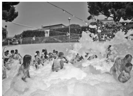
Imatges de la nostra festa major, dedicada, com sempre, especialment als més petits.