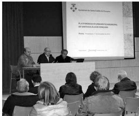
Presentació de l'avanç del POUM a la Biblioteca.

S'acorda aprovar l'Avanç de Planejament del POUM de Santa Eulàlia de Ronçana, redactat per l'equip tècnic urbanístic redactor Interlands ® ciutat i territori SLP i exposar-lo al públic per tal que es pugui consultar la documentació i formular els suggeriments i/o alternatives que consideri conuenients.