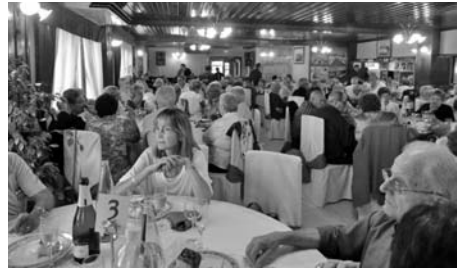
23è Aniversari del Casal: el dinar de germanor.

Al migdia va tenir lloc al Restaurant Paradís Park, el dinar de germanor amb una nombrosa participació de companys i companyes i membres del consistori del nostre poble. Tot plegat ens vam reunir 140 persones. Abans de començar el dinar el nostre Secretari, en nom de la nostra Presidenta, va dirigir unes breus paraules a tots els assistents, agraint la seva presència i també va donar la benvinguda als nous companys i companyes que s'havien incorporat durant aquest any, així com també va tenir unes paraules de record per tots aquells que ja no eren amb nosaltres i que estava segur que ells voldrien que els recordéssim amb alegria.