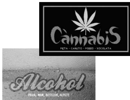
Targetes de la campanya de Festa Major 2012.

D'altra banda a la Festa Major, i coordinats amb Joventut, vam tenir l'estand del PPD la nit de divendres i dissabte donant informa-