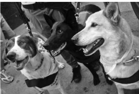
Alguns dels nostres gossos.

Així que podem dir que en deu mesos hem trobat llar a 64 gossos.