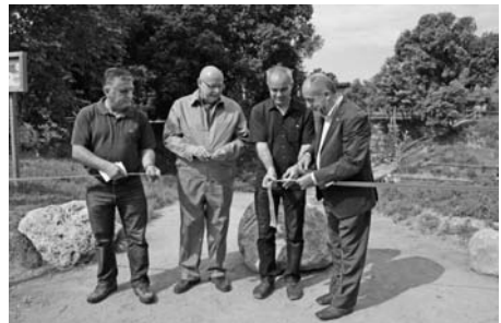
Les autoritats tallant la cinta al nou camí fluvial.