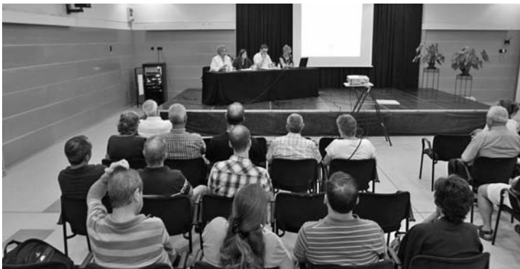
Presentació del Mapa del Patrimoni a La Fàbrica.

L'activitat a la Fàbrica no s'atura mai!