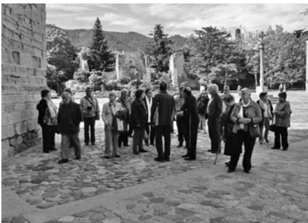
Monestir de Poblet.

El mes de setembre vam anar a Montserrat. Enguany la participació va ser molt minsa, només hi vam anar 27 persones. Alguns companys es van quedar amb les ganes de venir però primer és la salut, ja que els coincideix el dia de la sortida amb la visita del metge i no era qüestió de demanar el seu ajornament, ja que la visita és d'aquelles que et donen per d'aquí dos o tres mesos. Alguns altres suposem que els afecta molt més aquesta crisi que estem vivint però, sigui com sigui, vam passar un dia molt mogut ja que vam coincidir amb un allau d'estrangers, la gran majoria russos, que segons vam saber eren dels creuers que visiten Barcelo-