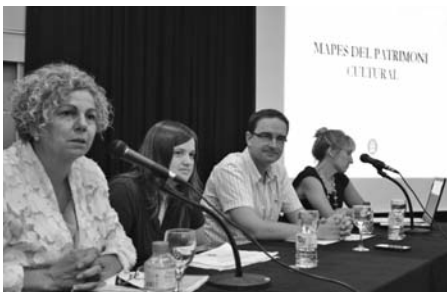
Presentació del Mapa del Patrimoni.

-Es va presentar al centre cívic La Fàbrica, el mapa del patrimoni, que és una feina exhaustiva i molt ben feta, amb un detall acurat del que representa el patrimoni cultural del poble i que es pot consultar a la pagina web de l'ajuntament.