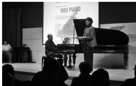
Acte d'inauguració del nou piano a la Biblioteca.