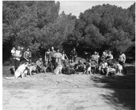
Primera Passejada ARBRA.

Pel que fa als gats, la xifra és encara més gran. En total n'hem recollit setanta vuit, la majoria d'ells trobats al carrer en caixes, amb tant sols dies de vida.