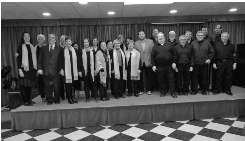
A Sant Vicenç dels Horts, amb el seu alcalde Oriol Junqueras.

Per acabar volem desitjar-vos unes bones festes de Nadal i un molt feliç any 2013.