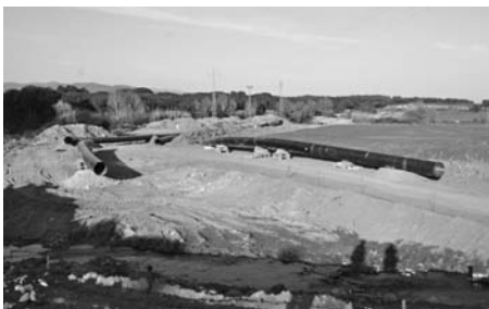
Els tubs del gasoducte ja travessen Santa Eulàlia.

- Els Mossos d'Esquadra desmantellaven a Santa Eulàlia un taller de falsificació de bitllets de transport públic de Barcelona. Alhora, detenien dos veïns residents al carrer Primavera, de nacionalitat búlgara, acusats de ser el cap i un dels principals tècnics falsificadors d'una banda que formaven almenys 10 persones.