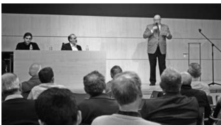
Reunió amb els proveïdors per explicar com faria front als seus deutes l'Ajuntament.

En el Ple de data 7 de juliol de 2011 van quedar pendents de designar dos vocals de