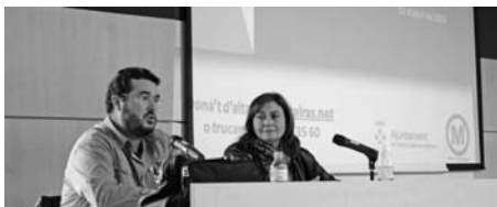
Presentació de xarxa d'Internet sense fils preWimax.