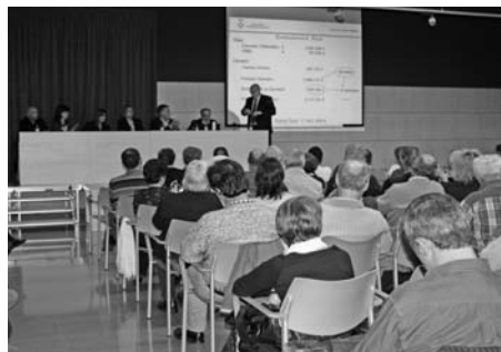
Presentació de l'Auditoria Externa a l'Ajuntament.

- Unes 260 persones assistien a l'estrena de la peça teatral No et vesteixis per sopar , una divertida comèdia d'embolics que el Teatre Nacional del Tenes portava a la Fàbrica.