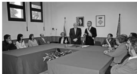
Signatura de l'agermanament amb Montville a la Sala de Plens de l'Ajuntament..

S'acorda ampliar el termini per a resoldre les al·legacions contra l'acord de 28 de juny de