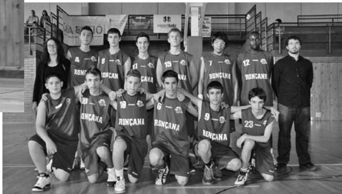
L'equip Cadet, finalista del Campionat de Catalunya.