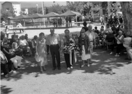
La participació a la Diada.

El passat dos de juny un grupet de trenta joves del nostre Casal, els més animats, atenen la invitació que ens va fer el Regidor de Joventut del nostre Ajuntament, per participar-hi en la gravació del Lip Dub de Santa Eulàlia de Ronçana, es van reunir al parc de darrera La Fàbrica per ballar una sardana amb el ritme de la "cúmbia" petonera. El resultat d'aquest videoclip es va poder veure a l'inici de la Festa Major. Ens hagués agradat una major participació dels nostres associats ja que aquest esdeveniment va estar anunciat, com qualsevol altre esdeveniment, al tauler d'anuncis del nostre Casal i per correu electrònic a tots el nostres socis que en el seu moment ens van facilitar la seva adreça de correu.