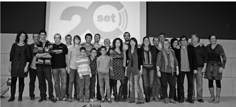
Els membres de Canal SET en la festa del seu 20è aniversari.

- Cinc experts europeus visitaven les obres