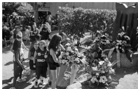
Ofrena floral a la Plaça Onze de Setembre.

- Tancava l'Escola Bressol La Font del Rieral. L'Ajuntament resolvia les al·legacions que s'havien presentat i acomiadava les sis educadores que quedaven. Les mestres lamentaven que el consistori enviés la policia a portar els documents d'acomiadament.