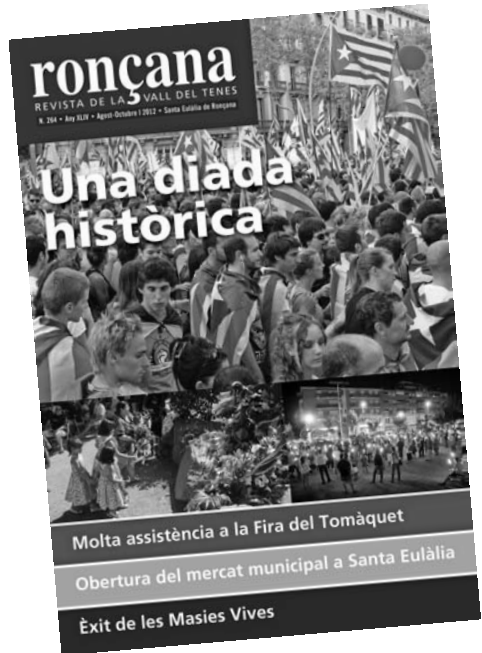
La portada de l'últim número, el 264.

Les diferents editorials publicades als números indicats han estat: "Cal que l'economia sigui ètica", en relació a la crisi que tan està afectant a la nostra "societat del benestar"; "Perseverança", com la prossecució continuada en quelcom iniciat, tot fent-nos ressò de la inauguració del Centre Ocupacional APINDEP; "30 Anys de la Mancomunitat de la Vall del Tenes", una Mancomunitat que passats els anys continua oferint serveis als habitants dels nostres pobles; "Crisis", tot reincidint en aquest tema donat el desconcert per les accions preses que afecten a gran quantitat de persones, de les que poc es parla a l'hora de prendre les decisions; "De la utopia al somni", amb posterioritat a la ma-