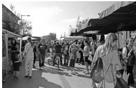
El nou mercat cada dia més concorregut.

S'acorda desestimar les al·legacions formulades respecte l'acord d'aprovació inicial de la modificació de la plantilla de personal d'a-