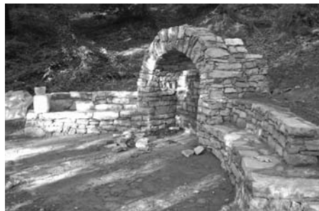
La Font d'Abril remodelada dis el projecte de millora del barri Font de Sant Joan.

S'acorda ratificar l'acord adoptat per la Junta de Govern Local de 19 d'abril de 2012, en que es va aprovar el preu públic per a la realització del taller de maquillatge al Centre Cívic i Cultural La Fàbrica per un import de 15 euros per alumne.