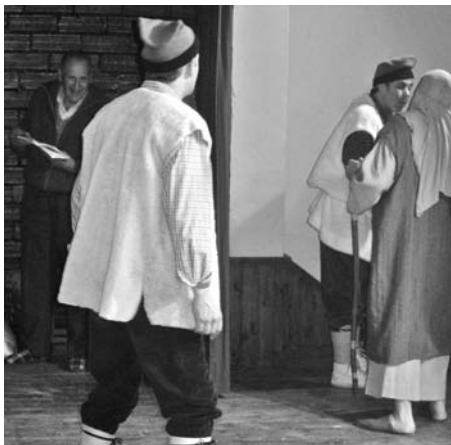
Fent d'apuntador als Pastorets.

actoràs. Ho feia molt bé. Li agradava el teatre i hi creia.