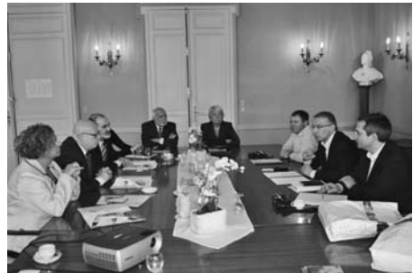
La delegació de Santa Eulàlia va ser rebuda per les autoritats de Montville.

- Santa Eulàlia inaugurava les noves dependències del jutjat de Pau, situades a la Sagrera, a l'edifici de les Antigues Escoles, al