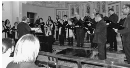
Concert del 21 de gener a Santa Eulàlia.

El dia 11 de novembre vam anar a cantar en la celebració del 80è aniversari d'un familiar d'un membre de la Coral, a l'esplèndida masia de Can Ribes de Montbui a Bigues.