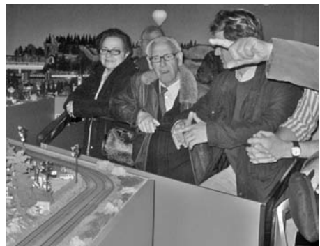
El món del tren a Santa Eugènia de Berga.

Un any més el nostre Casal va participar en la celebració d'aquesta diada. L'ofrena floral va ser feta per membres de la nostra Junta Directiva i també vam comptar amb l'assistència d'un nombrós grup de companys i