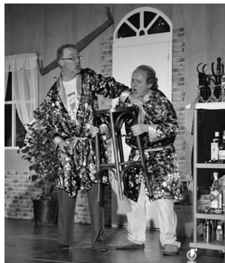
No et vesteixis per sopar.

Estem molt contents d'aquesta ampliació del grup ja que significa la constatació de la passió pel teatre que tenim la gent de Santa Eulàlia i la garantia de futur pel grup. Els grans del TNT explicarem en poques setmanes quina serà la nostra aposta teatral per aquesta temporada 2012/13, la dotzena de la companyia, que esperem que sigui tant exitosa com les anteriors.