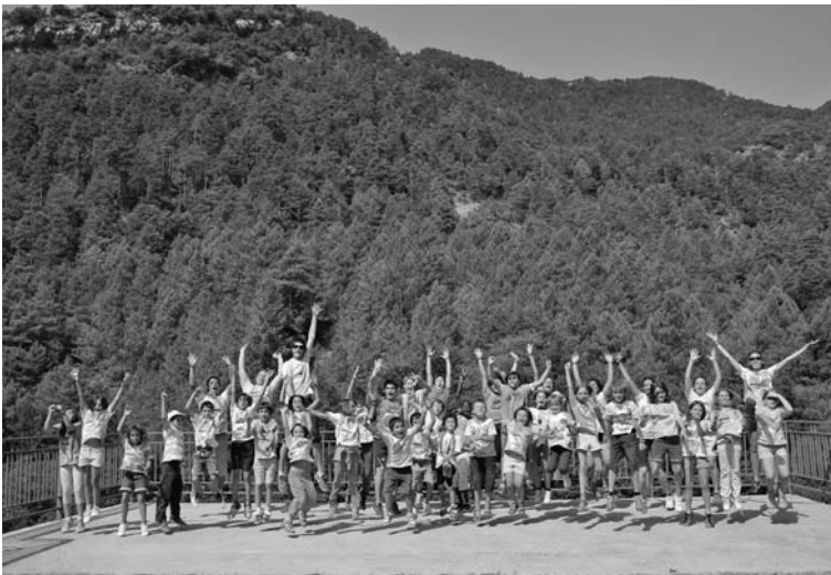
De campaments a Bagà.

Així que ja ho saps, si no tens res a fer els dissabtes a la tarda, a Sant Simple serem una bona colla i mai no hi sobra gent!