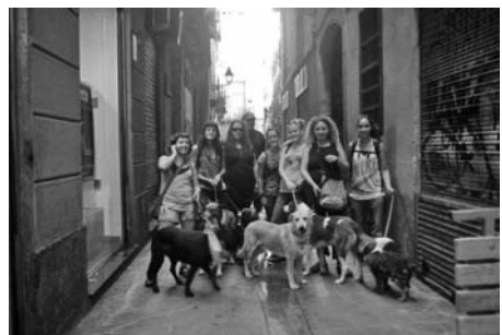
Festa de la Mercè.

Ell ha de ser un membre més. El qual ha de tenir totes les seves necessitats cobertes,