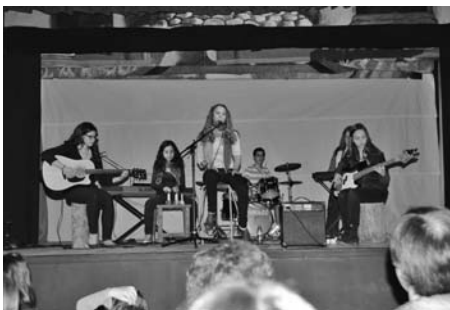
Da Capo en el festival en benefici de Càritas.

El diumenge 25 de març es va fer un concert en benefici de Càritas organitzat pels joves artistes de l'escola de música "Da Capo" que ens van fer gaudir amb les seves cançons i peces musicals. També hi va participar el grup de teatre infantil del Casal amb la representació de dos contes: "L'abecedari so-