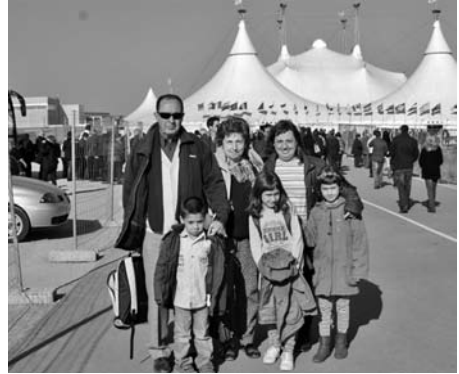
Al Círc du Soleil.

declarada Monument Històric-Artístic l'any 1931, actualment també té la categoria de Bé d'Interès Cultural. Acabada aquesta interessant visita, les 49 persones que van venir vam anar a celebrar la festa de la calçotada a un acreditat restaurant de la zona.