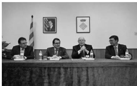
Després de la inauguració, el President de la Generalitat va signar el llibre d'honor de l'Ajuntament a la Sala de Plens.