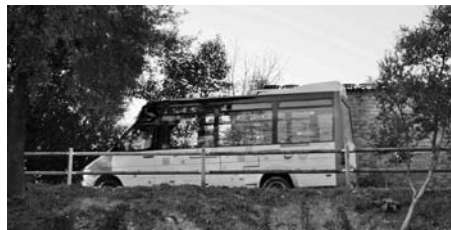
El Bus d'APINDEP que presta el nou servei gratuït per a Gent Gran.

- Durant les Festes de Nadal, el Casal Parroquial estrenava l'adequació de l'escenari amb les dues representacions dels Pastorets. Desenes de nenes i nenes seguien la cavalcada.