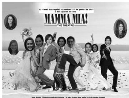
Els joves de l'Institut representen Mamma Mia!

lidari" i "L'ós Iamikè". Tots dos pretenien fer-nos adonar de les injustícies i desigualtats que hi ha en el nostre món, tot allò que les provoca i com podem solucionar-ho si les persones ens unim. Hi van assistir un bon nombre de persones que es van fer seva aquesta proposta. Al finalitzar l'última actuació, els voluntaris de Càritas van agrair l'aportació i generositat d'aquests joves.