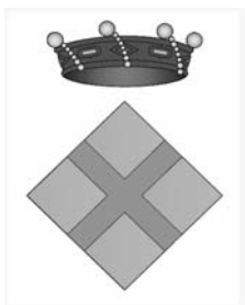
El nou escut de Santa Eulàlia.

L'alcalde explica que davant la possibilitat que una petita part de terme municipal de Santa Eulàlia de Ronçana, formada per tretze finques -dotze cases i un solar-, passi a formar part de Caldes de Montbui, municipi que a la pràctica ja presta els serveis d'aigua, llum, recollida d'escombraries, assistència de policia local, etc., i que a resultes d'una reunió amb els veïns d'aquesta zona en què la majoria estaven molt a favor d'aquest traspàs, es va acordar que s'iniciés el procediment i es nomenés una comissió, tal com ja s'havia fet a Caldes, per poder-ne fer ús, en el supòsit que es porti a terme aquesta nova delimitació dels termes municipals.