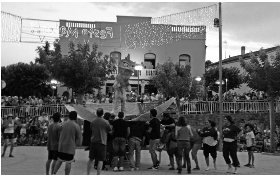
Així va començar la Festa Major. A la pàgina anterior: Reis, Carnestoltes, Sant Jordi i Sant Joan.