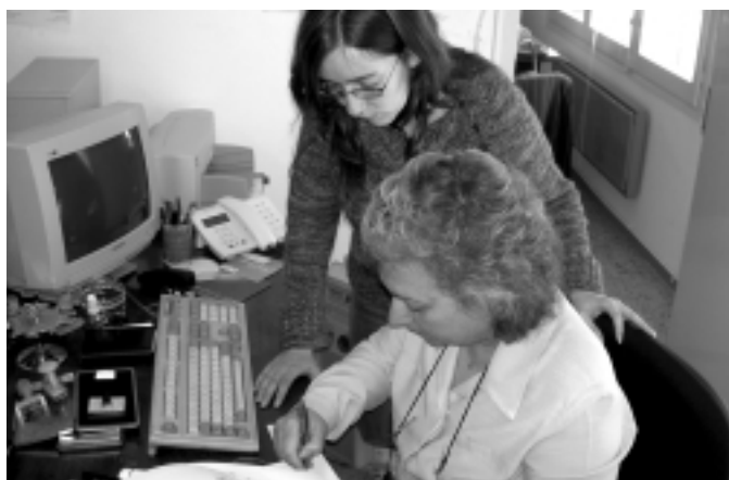
El Jutjat de Pau s'ha agrupat amb el de Bigues i Riells (a dalt) Nou arbrat a l'aparcament de La Fàbrica (a baix)