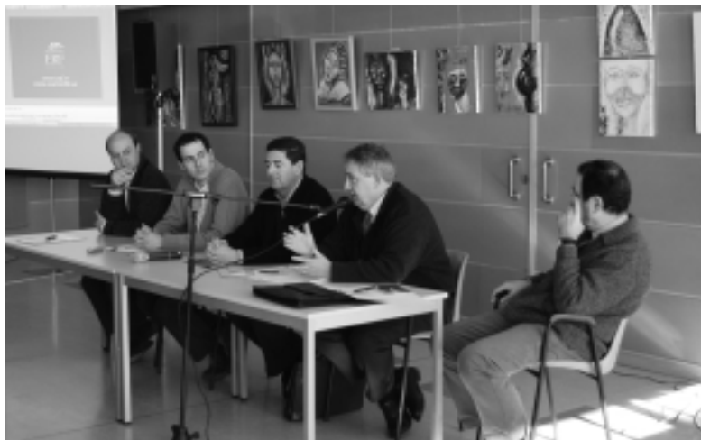
El POUM es va presentar en públic el 15 de gener a la Fàbrica.

En el Ple del 27 de gener es va aprovar, amb els vots en contra de Covergència i Unió i Partit Popular , la suspensió potestativa de tramitacions i d'atorgament de llicències urbanístiques en 13 àmbits de Santa Eulàlia. La mesura afecta el PERI Camí de la Serra; els Plans Parcials de Can Naps, el sector 2 Camí de Caldes i Can Miravall; la unitat industrial d'Hopresa; les unitats de Pitarra i Can Mataporcs; els carrers, Font de Sant Cristòfol i Riereta i, parcialment, les unitats de Salve Regina, La Campinya, Sant Isidre i Can Sabater. Aquestes suspensions de llicències, que es van fer a proposta de