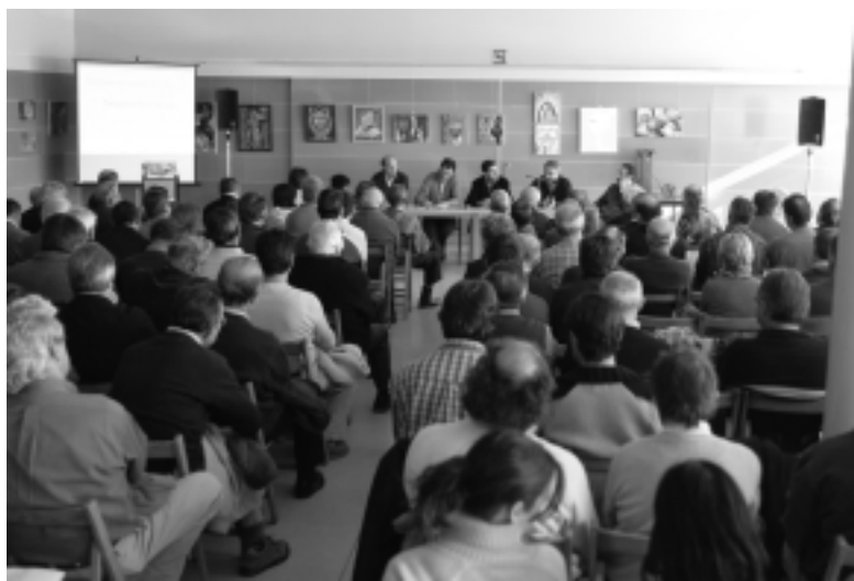
Unes 150 persones van assistir a la presentació.

l'equip redactor, són preventives durant el procés de definició del nou planejament. L'acord afecta aquells sectors que no s'han desenvolupat fins ara, importants per al municipi, i els sectors potencialment inundables.