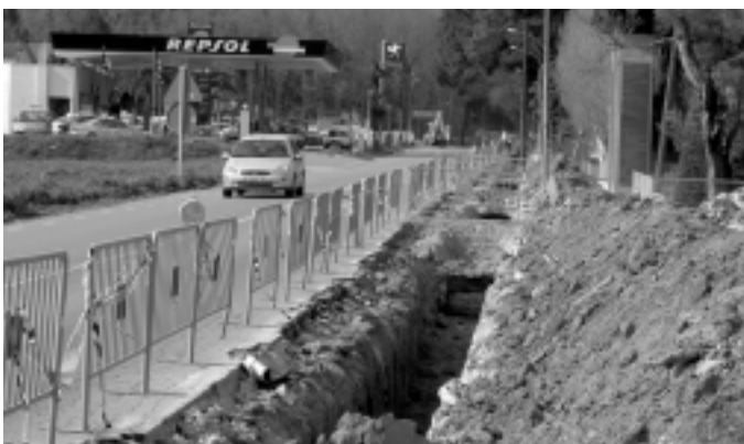
La segona fase del camí de vianants ja ha començat

de vianants amb semàfor. Des d'aquí el vial retrocedirà fins el camí de la Casa Vella i continuarà, fins arribar a la rotonda del camí de la Creueta pel costat esquerra de la carretera. Les obres s'aprofitaran per portar la xarxa d'aigua municipal a la zona de la benzinera. El camí de vianants tindrà enlluminat públic i se soterraran les línies elèctriques i de telefonia. També s'instal·larà mobiliari, es construiran les parades d'autobús i una tanca per separar el camí de la carretera. Per a l'Ajuntament, la segona fase del camí de vianants és una obra important que afecta tota la ciutadania per l'ús que se'n pot fer. Els treballs es finançaran amb aportacions del consistori i amb una subvenció de 50.000 euros de la Diputació. Les empreses del sector de la benzinera es faran càrrec de les obres de la xarxa d'aigua municipal.