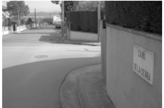
Es revisarà la numeració i el nom d'alguns carrers