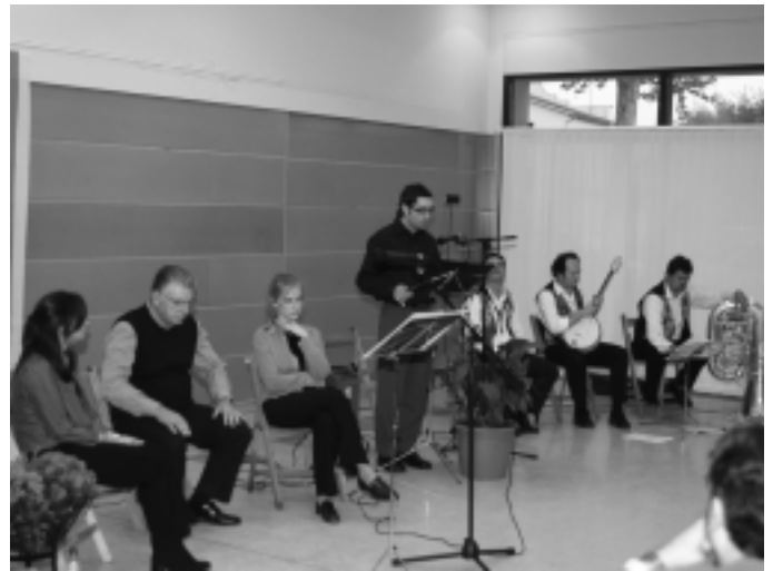
L'acte central de Sant Jordi es farà a la Fàbrica el 23 d'abril

El diumenge es dedicarà a tancar el primer quart de segle de l'Esplai Santa Eulàlia i a la diada que es farà al parc fluvial de Can Font. Al Cau, a Sant Simple, els monitors de l'Esplai han previst una gimcana, una ballada amb la colla