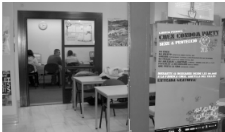
Les reunions dels grups de discussió s'han fet al Punt d'Informació

Durant les darreres setmanes, s'està treballant en el pla d'acció, les actuacions que caldria dur a terme. El document s'acabarà en els pròximes setmanes amb la discussió de les conclusions i del pla d'acció amb els joves.