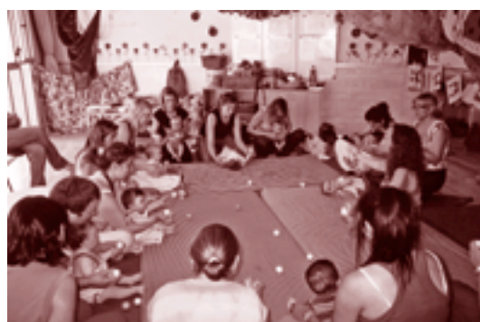
L'Espai Nadó aquest any s'organitzarà a la biblioteca municipal