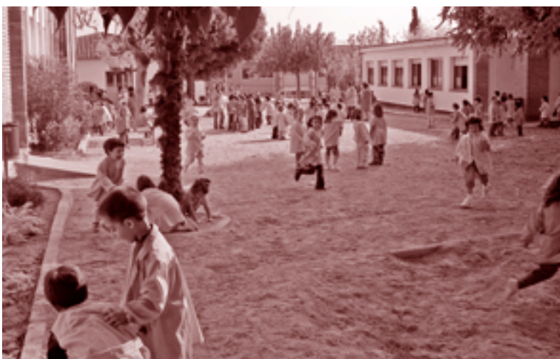
L'Escola Ronçana acull més de 600 alumnes

Fa un temps que Santa Eulàlia de Ronçana ha superat la barrera del miler d'infants i joves escolaritzats al poble. La novetat a l'inici del curs 2007-08 és el segon centre de primària que ha començat a funcionar, compartint espais amb el CEIP Ronçana. El curs que ve l'escola del Rieral ha de recuperar la normalitat després de diversos anys de saturació d'espais.