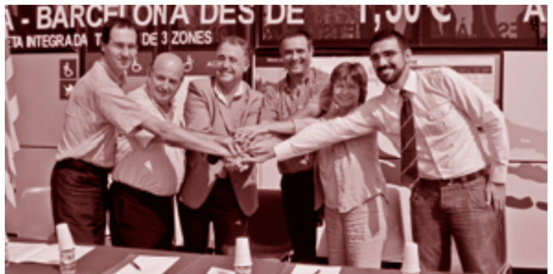
Els alcaldes van signar el conveni de sol·licitud a Parets, el 17 de setembre.

Amb l'objectiu d'aconseguir un transport públic eficient i ràpid, els Ajuntaments de la Vall del Tenes i Parets del Vallès, en col·laboració amb l'Associació per la Promoció del Transport Públic (PTP) han unit esforços per demanar a la Generalitat una línia d'autobús que arribi a Barcelona en 40 minuts i sense fer transbordaments. Ja s'han fet totes les gestions per presentar la sol·licitud i el projecte al Departament de Política Territorial i Obres Públiques. El projecte preveu un autobús cada 15 minuts entre les 6 i les 9 del matí i a partir d'aquí cada mitja hora, fins les 11 de la nit. Hi haurà dues parades a cada poble, i a partir de Parets, el trajecte es farà per autopista.