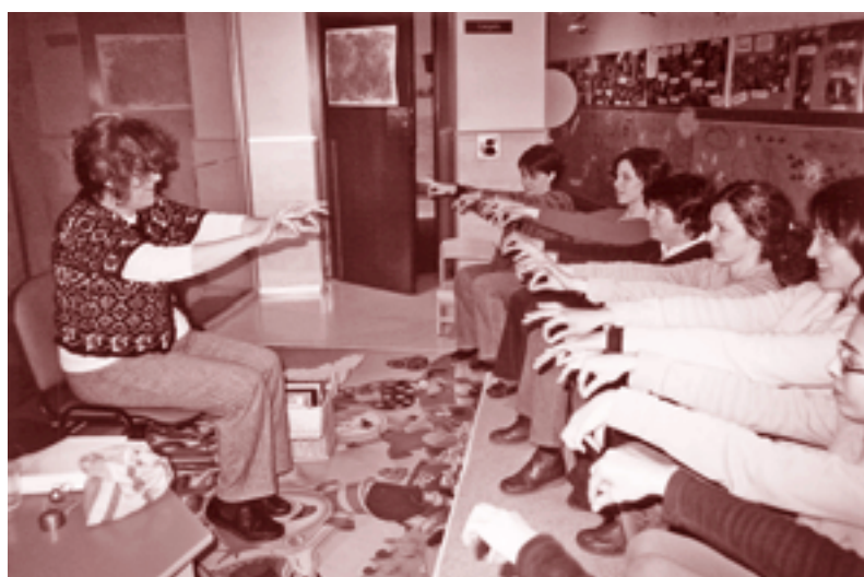
Alguns tallers es fan a l'Escola Bressol l'Alzina