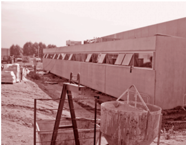
El CAP hauria d'estar acabat a mig novembre