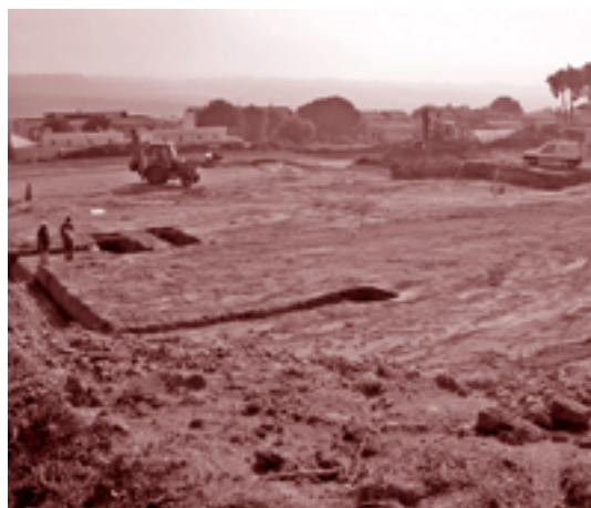
Les obres de la segona escola, a la Sagrera

EL CEIP Ronçana ha obert un curs atípic. Enguany disposa de més de 600 alumnes. 480 pertanyen al centre i la resta correspon a nens i nenes de la segona escola que s'està construint a la Sagrera. L'endarreriment de les obres, ha fet que, almenys durant un trimestre i mig, alumnes i professorat del CEIP Ronçana i del nou centre de primària hagin de conviure en un mateix espai. Això vol dir que les instal·lacions l'escola Ronçana, l'únic CEIP del poble, s'hagin hagut d'adequar a aquests increments L'Ajuntament ha habilitat dos espais com a aules i en un mateix espai hi ha dos grups de P3 amb dues mestres. A més, es mantenen les aules prefabricades que van entrar en funcionament ara fa un any i serveis, com el menjador, han augmentat notablement. L'endarreriment de les obres també ha comportat l'ajornament de la sisena hora.