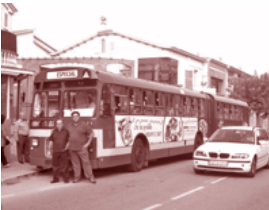
Els busos de l'ARCA van fer diversos viatges amb parades a Lliçà d'Amunt, Santa Eulàlia i Bigues i Riells

Continuant amb el programa d'actes, durant la darrera setmana de setembre, el transport urbà municipal va ser gratuït. Unes 1000 persones van beneficiar-se d'aquesta iniciativa. Finalment, el dia 29, coincidint amb la finalització d'aquestes jornades dedicades a la mobilitat sostenible i segura, els Ajuntaments de Santa Eulàlia, Lliçà d'Amunt i Bigues i Riells, i l'Associació per la Recuperació i Conservació d'Autobusos (ARCA) van promoure unes passejades gratuïtes en autobusos dels anys 60 i 70. L'Agenda 21 també va col·laborar en aquesta diada.