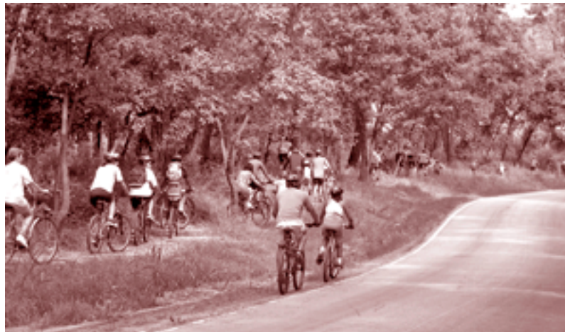
La pedalada va recórrer uns 7 quilòmetres pel poble

Entre el 22 i el 29 de setembre es va celebrar la Setmana de la Mobilitat Sostenible i Segura. Aquest any, Santa Eulàlia ha estat un dels 100 municipis que ha organitzat activitats que pretenen potenciar altres tipus de transport diferents al vehicle privat. Els actes van iniciar-se el 23 de setembre amb una volta en bicicleta que va passar pels trams urbans que s'han adequat els últims anys per millorar la seguretat de viants i ciclistes. La pedalada va mostrar que es pot agafar la bicicleta o anar a peu a fer tasques tan quotidianes com comprar el pa o el diari. Precisament per fomentar-ne i recordar-ne l'ús, l'Ajuntament ha instal·lat aparcaments per a bicicletes als equipaments públics del poble.