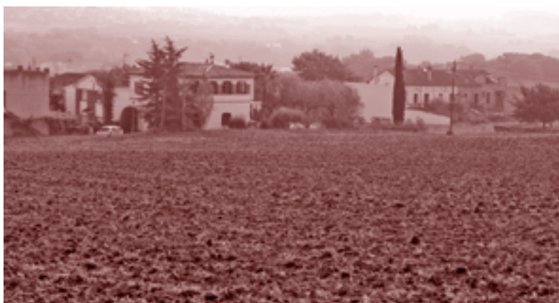
La segona escola bressol s'ha de construir en terrenys del PERI Camí de la Serra.

L'equip de govern fa temps que treballa per poder generar una segona escola bressol municipal. La Junta de Govern del 24 de maig va aprovar la licitació per contractar la redacció del projecte. Durant el termini de presentació de sol·licituds hi ha hagut 20 propostes, 3 de les quals han quedat excloses perquè superaven el preu de licitació, que era de 43.500 euros. Ara, els serveis tècnics municipals i l'equip de govern estan analitzant els altres 17 projectes. El Consell Escolar Municipal ha expressat la seva opinió perquè, una vegada elaborat l'informe pels serveis tècnics municipals, la redacció del projecte de la segona escola bressol s'adjudiqui a una de les empreses. El centre s'ha de construir al PERI Camí de la Serra.