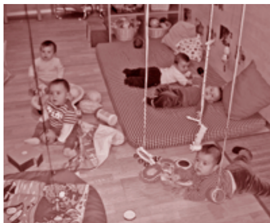
La classe dels Cargols, a l'Escola Bressol l'Alzina

La llar d'infants ha iniciat el quart curs amb una aula nova. Per això s'ha hagut d'habilitar l'espai polivalent que hi ha a l'entrada del centre. Ara mateix l'escola disposa de 7 aules. Una per a nadons, de mesos a 1 any, tres per a infants d'1 a 2 i tres més per a nens i nenes de 2 a 3 anys. Actualment, l'escola acull 107 infants i hi ha dues educadores per aula. El ple municipal del 27 de setembre va aprovar amb els vots a favor d'IND-ERC, PSC i PP i amb els vots en contra de CiU, els nous preus per a aquest curs (vegeu quadre adjunt) La quota mensual és de 139 euros.