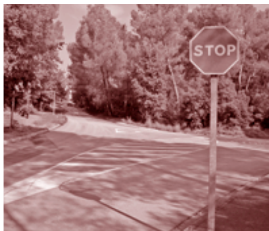
L'Ajuntament ha millorat la senyalització vertical i horitzontal en diversos vials

D'altra banda, per regular i millorar el trànsit de vehicles, s'han fet alguns canvis en el sentit de circulació de diversos carrers. Les mesures adoptades per la comissió de vialitat afecten el trànsit a la carretera de la Sagrera, el camí de Caldes, el carrer Mestre Joan Batlle, el camí de la Rovira i el Rieral, on s'hi ha instal·lat un semàfor per permetre una millor sortida als vehicles que vénen dels carrers Mare de Déu de la Salut, del Carme i del Camí de can Torras. Durant el setembre es va instal·lar la senyalització vertical per informar els conductors d'aquests canvis i es va repintar la senyalització horitzontal als principals carrers de Santa Eulàlia de Ronçana.