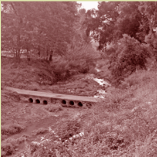
El Riu Tenes, a la Font de Sant Cristòfol.

Com a desenvolupament del conveni signat entre l'Agència Catalana de l'Aigua (ACA) i l'Ajuntament de Santa Eulàlia de Ronçana el febrer passat, al juliol es van iniciar els treballs de redacció dels projectes de correcció hidrològica que s'han de fer al riu Tenes. L'ACA va adjudicar l'elaboració dels projectes a l'empresa TYPESA. El calendari previst per l'Agència Catalana de l'Aigua és que la redacció dels set projectes acabi l'estiu que ve. Les set fases s'estan redactant en paral·lel i seqüencialment. Per tant, la primera redacció, corresponent a la bassa de laminació, ha d'estar acabada a finals d'aquest any i la darrera, a l'estiu del 2008. En cadascun d'aquests projectes hi haurà d'haver la tramitació administrativa corresponent i es preveu que l'execució dels primer projecte comenci a finals d'estiu que ve i que l'últim acabi la tardor del 2010. Durant aquest setembre s'ha reunit la comissió de veïns i la comissió de seguiment de les obres.