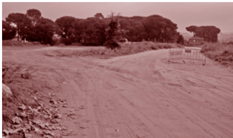
L'accés a Can Sabater s'ampliarà i es farà més senzill.

El procés de licitació de les obres del camí d'accés a can Sabater va acabar fa pocs dies. El preu final de licitació es va haver d'incrementar un 10% perquè la primera licitació va quedar deserta. L'empresa adjudicatària ha estat AMSA que va ofertar fer-la per 220.000 €. Aquesta obra compta ja amb una subvenció de 125.000 € del Pla Únic d'Obres i Serveis de Catalunya (PUOSC) que impulsa la Generalitat. S'ha demanat una ampliació d'aquesta subvenció de 84.000 € que s'espera que sigui concedida per fer front als increments que hi ha hagut en el disseny i la licitació. Els treballs consistiran en adequar l'actual accés al barri des de la carretera de Barcelona ampliant-lo molt per incrementar la visibilitat i evitar accidents. També es varia el traçat del camí actual per anar a enllaçar directament amb el carrer Fonteta que fins ara estava tallat. El camí comptarà amb un pas per a vianants i bicicletes diferenciat de la calçada.