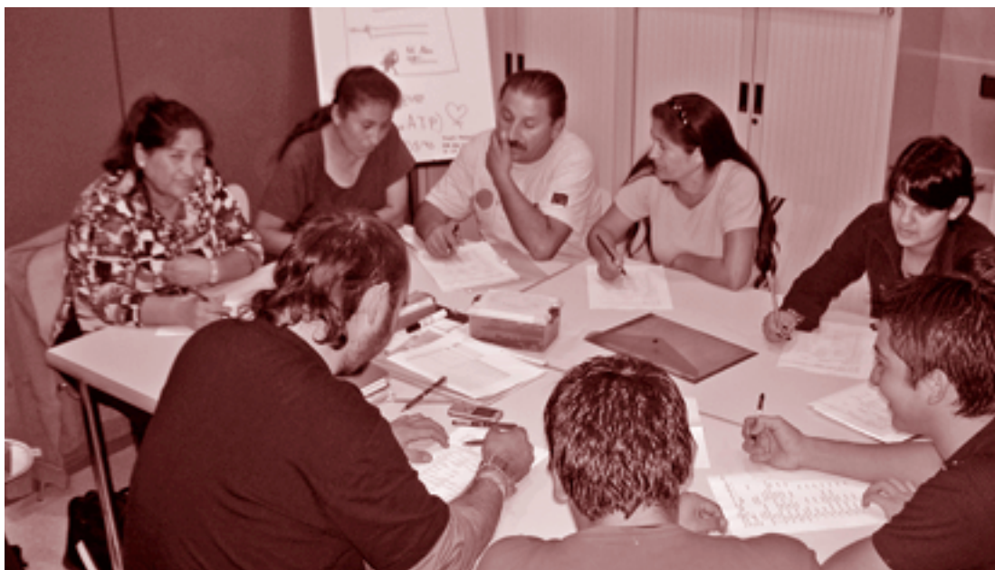
Un moment d'una classe de català per a immigrants