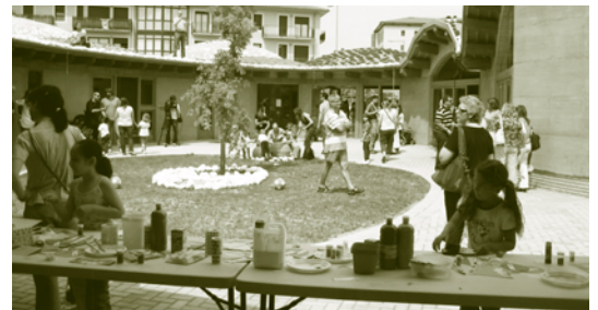
El pati interior de l'escola bressol durant el dia de portes obertes