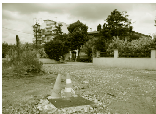
Ja estan acabades les obres que doten de clavegueram els habitatges de Can Careta