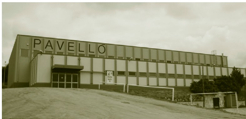
El nou aspecte de la façana del pavelló

Les actuacions s'han fet des de la Ferreria, pel Camí del Gual, passant per Can Careta fins al col·lector de La Riereta, un sòl no urbanitzable amb un assentament de cases antigues. Fins ara aquests habitatges es servien de pous cecs i un camió cisterna