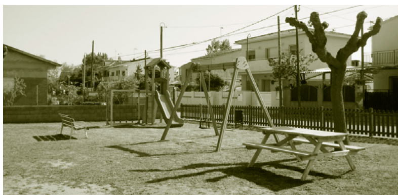
El parc de Can Sabater ara té una àrea de joc infantil i una altra de pic-nic

passava a retirar les aigües residuals per portar-les a tractament. Les noves instal·lacions representaran un estalvi pels veïns i una millora pel Medi Ambient, ja que amb el nou sistema s'evitaran les fuites.