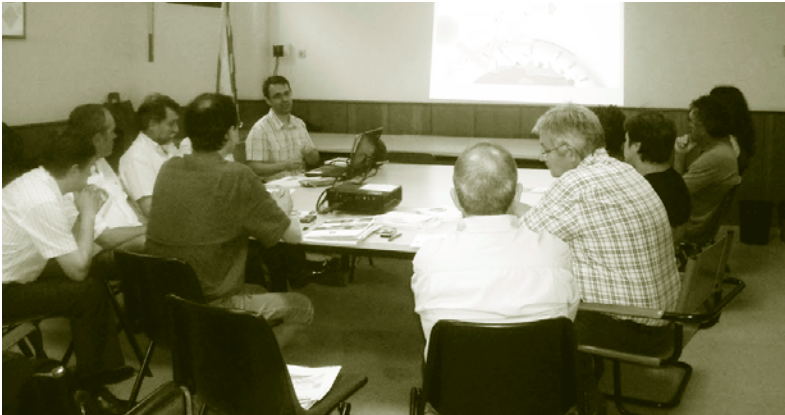
Reunió del Consell del Medi Ambient de Santa Eulàlia de Ronçana

Arran de l'adhesió al Pacte, el municipi està elaborant un Pla d'acció per l'energia sostenible (PAES), que fa un inventari de les emissions de CO 2 del municipi i que definirà les actuacions necessàries per reduir el consum d'energia i les emissions de gasos d'efecte hivernacle. Per redactar el PAES, l'Ajuntament compta amb la col·laboració d'empreses de consultoria ambiental i amb el suport de l'Àrea de Medi Ambient de la Diputació de Barcelona.