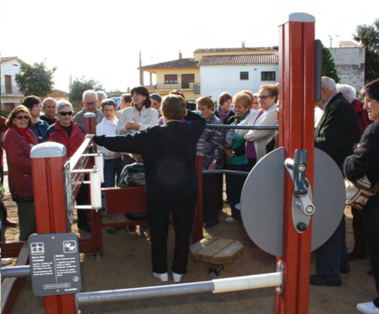
POSA'T EN FORMA