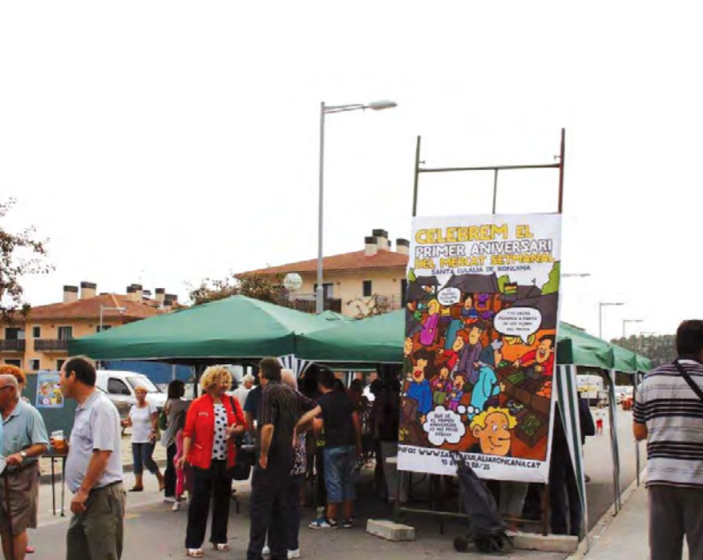
COMPRA DE PROXIMITAT