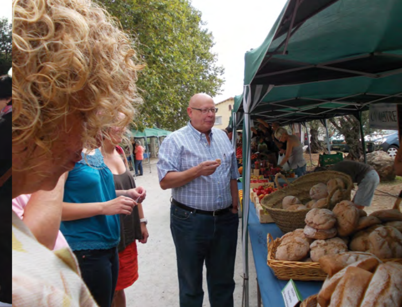
FIRES I FESTES